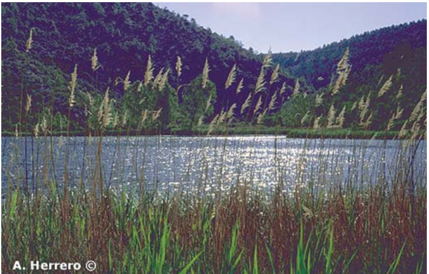
Phragmites australis . A. Herrero.