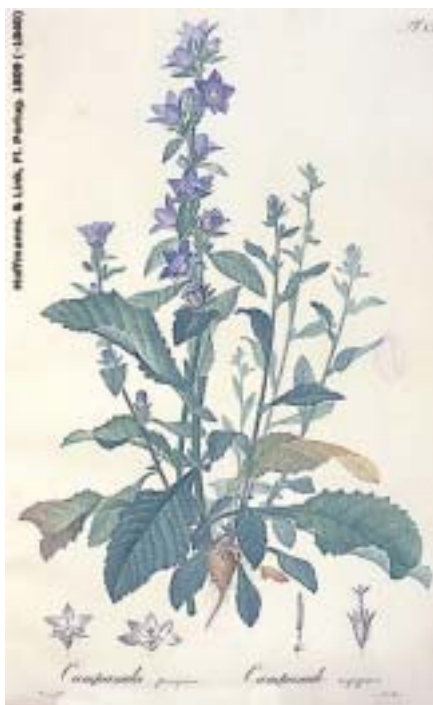
Campanula peregrina . Lámina de Hoffmanssegg & Link.

ayuda inestimable: el programa "Anthos", un sistema informático impulsado por la Fundación Biodiversidad y el CSIC que permite acceder más fácilmente a la información disponible sobre las plantas silvestres españolas. Para su puesta en marcha se partió de la información y la experiencia del equipo que elaboró el Proyecto Flora ibérica, el primer intento de reunir toda la información referida a la flora autóctona y, por tanto, el antecedente inmediato de este programa.