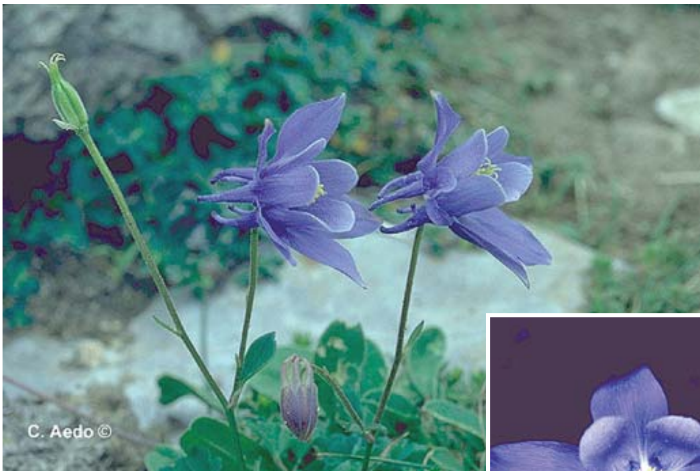
Aquilegia pyrenaica . C. Aedo.

cos que se proporcionan corresponden a los géneros publicados en ocho volúmenes de la obra Flora Ibérica.