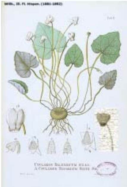
Cyclamen balearicum . Lámina de Willkomm.