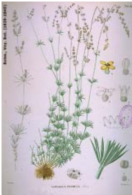
Asperula pendula . Lámina de Boissier.