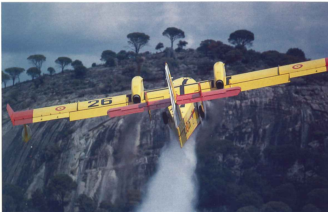
■ El Ministerio de Medio Ambiente colaborará con las comunidades autónomas para poner freno a los incendios forestales.

Unos presupuestos que nacen con un significativo aumento respecto al año anterior. En concreto, para llevar a cabo todos los programas para la gestión de los recursos naturales en nuestro país, el Ministerio contará con un presupuesto de 445.685 millones de pesetas. De esta cantidad se destinarán al capítulo de inversiones un total de 330.497 millones de pesetas, a la que hay que añadir 202.708 millones de pesetas que destinan las Sociedades Estatales de Agua a actuaciones hidráulicas en todo el territorio nacional, además del resto de las Sociedades, EMGRISA y La Almoraima con