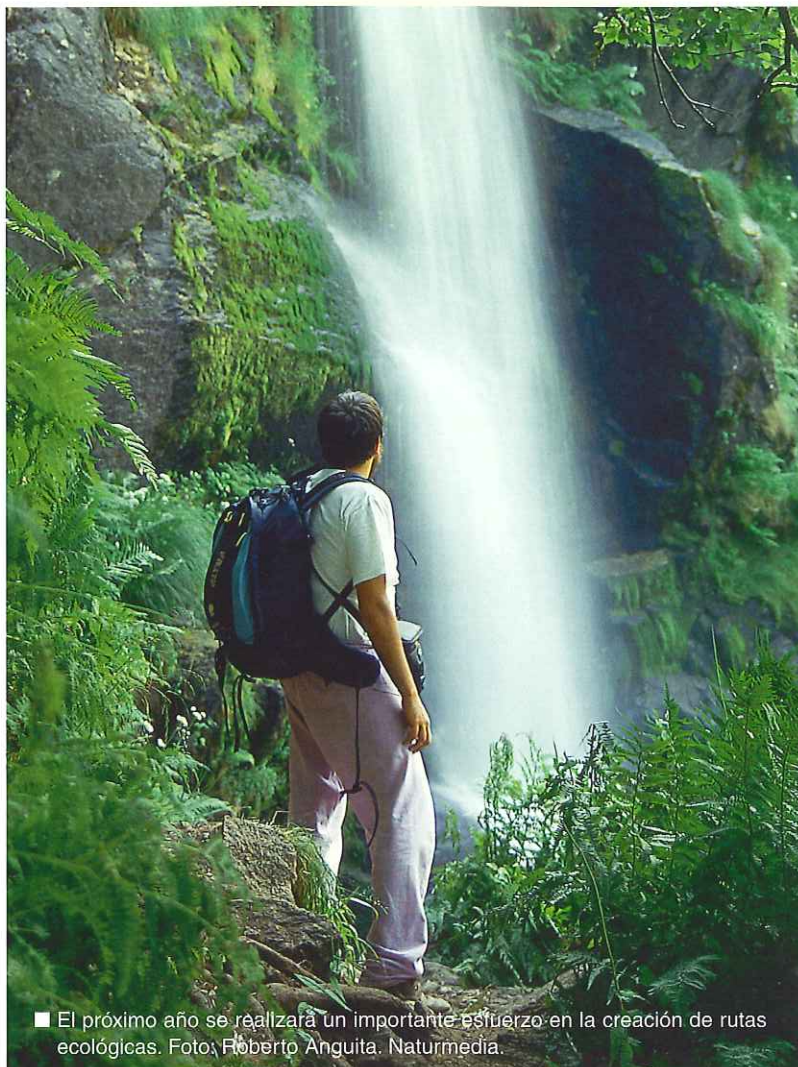
■ El próximo año se realizará un importante esfuerzo en la creación de rutas ecológicas.

También cabe destacar las aportaciones del Ministerio de Medio Ambiente a las comunidades autónomas, que tal y como apuntan desde la Dirección General de Programación y Control Económico y Presupuestario, no pueden examinarse exclusivamente a partir de las partidas presupuestarias que aparecen en el proyecto de Presupuestos nominativamente como transferencias a comunidades autónomas, ya que debe tenerse en cuenta que todas las inversiones del Ministerio, de sus Organismos Autónomos y de las Sociedades Estatales se ejecutan en territorio de las comunidades, por lo que son receptoras y beneficiarias de dichas inversiones. De hecho, el proyecto de Presupuestos para 2002 prevé, con carácter general y respecto a los de 2001, un incremento de la inversión en todas las comunidades autónomas. ■