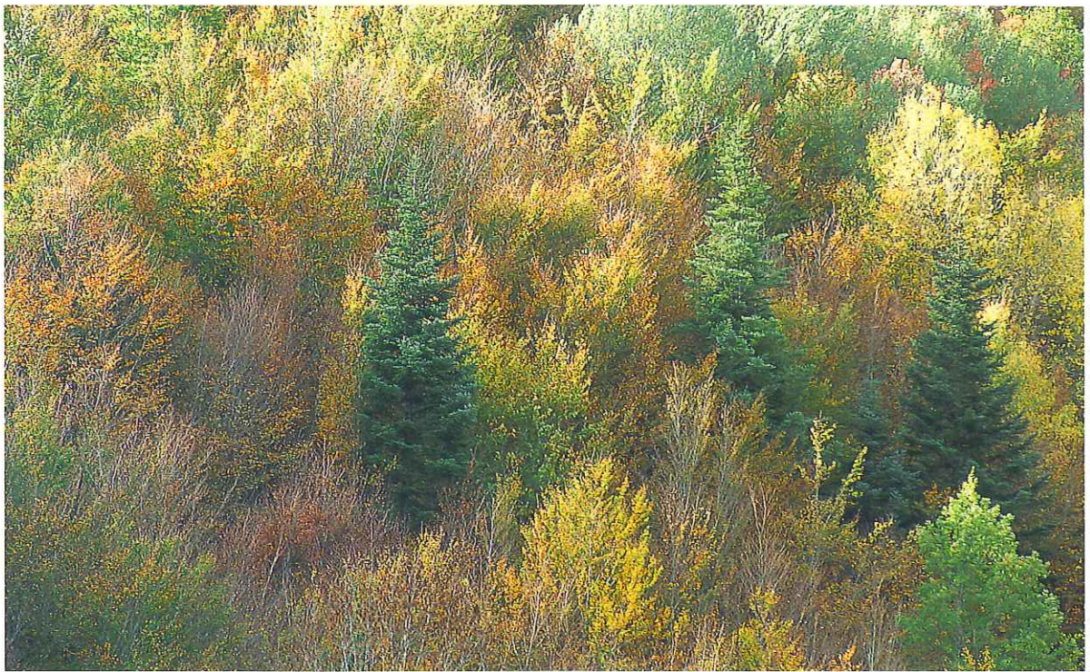
■ Una importante partida presupuestaria está destinada a proteger los montes contra la erosión y la desertificación.

creación de rutas ecológicas, que se enmarcan dentro del Programa de Caminos de la Naturaleza que se pondrá en marcha en todo el territorio nacional. El objetivo fundamental de este programa es fomentar actividades relacionadas con el medio ambiente que favorezcan el desarrollo turístico, y por tanto económico, de una determi-