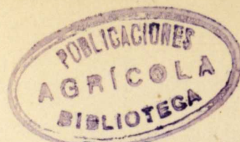
Cuadro núm. 173.