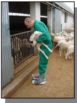
Ilustración 3.- Detalle pesado de cordero

La aplicación de los animales se realizó en una sola jornada el día 26 de octubre de 2006. Para la aplicación, realizada por tres técnicos diferentes, se emplearon las pistolas aplicadoras indicadas por el fabricante.