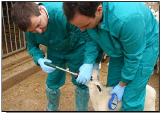
Ilustración 2.- Aplicación de bolo ruminal "mini" en cordero

Los animales debían ser identificados por operadores, con capacidad y experiencia probada en la aplicación de este tipo de dispositivos.