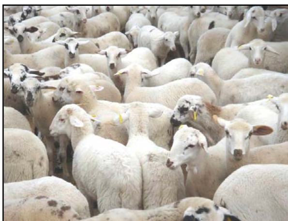
Ilustración 1.- Corderos de la raza Rasa Aragonesa

La importancia de la recuperación de dispositivos cerámicos, tipo bolo ruminal radica en dos aspectos fundamentales, en primer lugar asegurar el cumplimiento de la Norma ISO 11784 por la que se debe garantizar la no reutilización de los dispositivos empleados en Identificación Electrónica Animal (IEA), y en segundo lugar, asegurar que ningún minibolo ruminal o porción de este alcance la cadena alimentaria, tanto humana, como la de los animales de compañía elaborada a partir de subproductos del matadero.