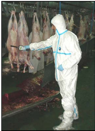
Ilustración 5.- Control de lectura manual - desollado

El segundo punto de control de lectura seleccionado fue dentro de la cadena de faenado en un punto anterior a la máquina de desollado, para ello se emplearon dos lectores de diferentes fabricantes, un lector Ges2S de la empresa Rumitag y un lector de mano de la empresa Cromasa.