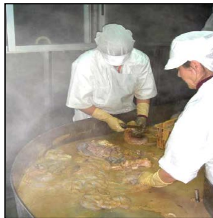
Ilustración 7.- Sala de tripería