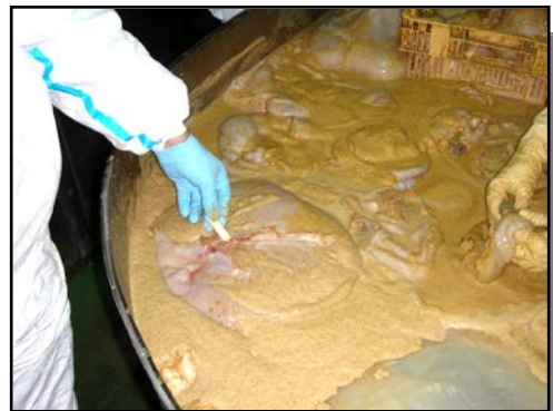
Ilustración 6.- Recuperación de dispositivos en sala de tripería

En cuanto a la vía destinada a consumo humano y debido a la esmerada limpieza a la que se somete la tripa para este destino, es altamente improbable que algún dispositivo se perdiera por esta vía. Por lo tanto, y debido a sus características similares a las de un desagüe, la vía por la que se perdieron todos, o la gran mayoría de dispositivos no recuperados fue sin duda la destinada a destrucción.