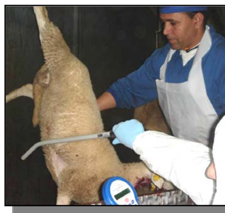
Ilustración 4.- Control de lectura manual - degüello

Se estableció un primer punto de control mediante lectura manual con un lector Ges2S de la empresa Runitag equipado con un stick en el punto de sacrificio, leyéndose los animales antes del degüello. En este punto se registraron sin ninguna incidencia los 296 animales presentes.