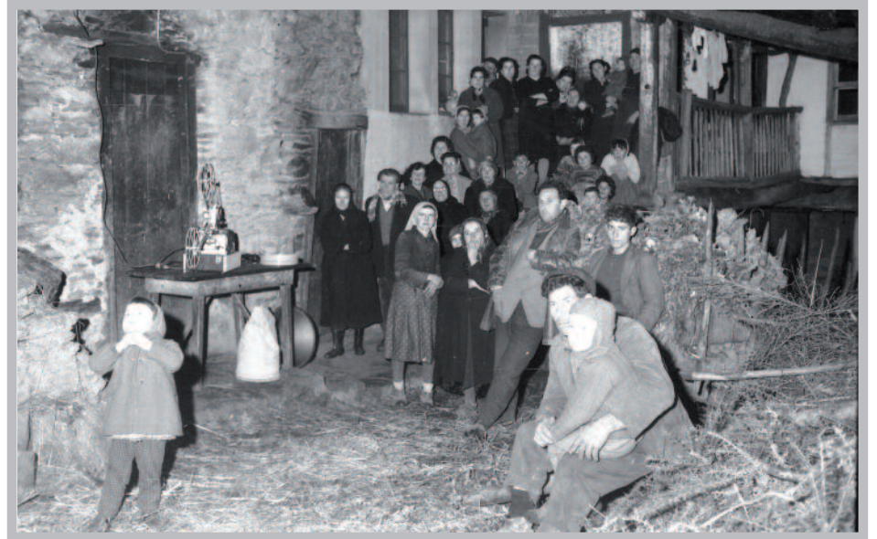
Monforte de Lemos (Burgos), año 1961. Fascinados por la imagen. Proyección organizada por la Agencia de Extensión Agraria del Ministerio de Agricultura.

Este último organismo colaboró con Televisión Española para la realización de documentales de la naturaleza dirigidos por el inolvidable Félix Rodríguez de la Fuente. Concretamente, la mítica serie El hombre y la tierra , producida por TVE con la colaboración del ICONA, fue la primera superproducción televisiva de nuestro país y la obra cumbre de los documentales de la naturaleza, habiendo sido proyectada en más de 40 países y visionada por más de 800 millones de personas. Utilizando tecnología digital de última generación se ha iniciado una edición completamente restaurada de esta serie.