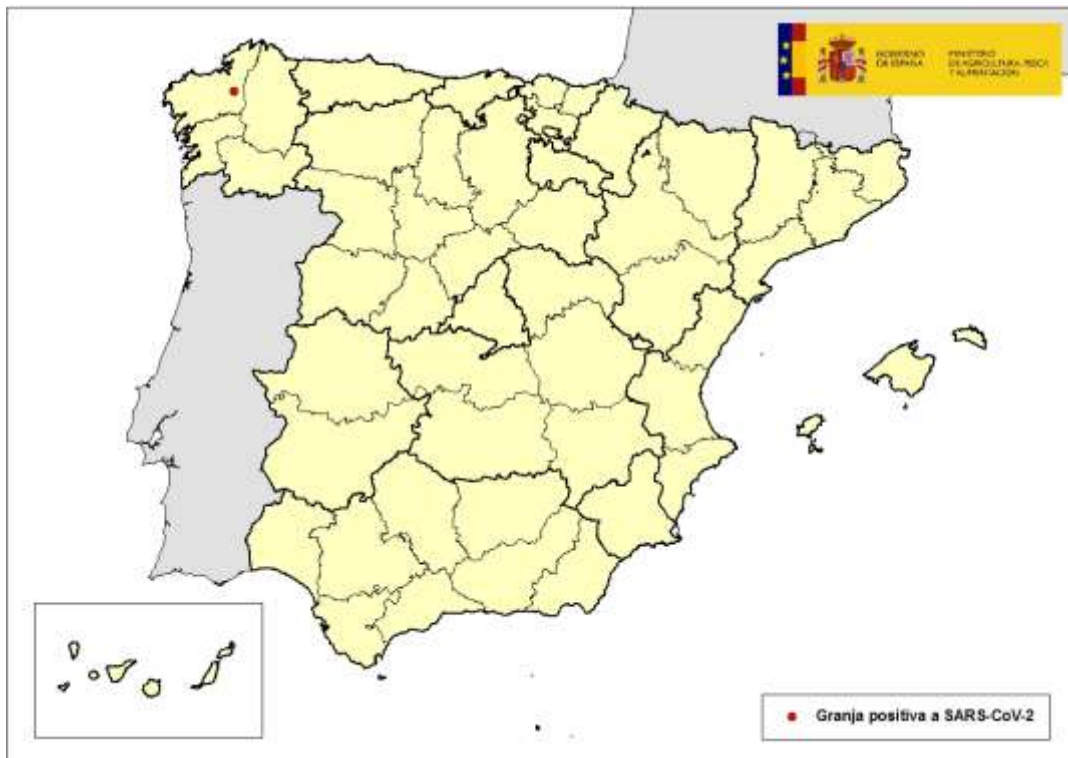
Mapa 1: localización de la granja afectada por SARS-CoV-2 en A Coruña, Galicia

La explotación afectada se localiza en el municipio de Curtis y cuenta con un censo de 11.600 animales (3.100 hembras reproductoras y 8.500 crías) (ver mapa 1)