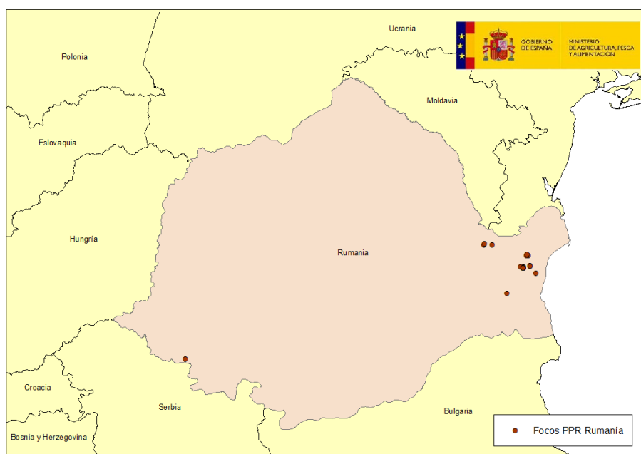
Mapa 2: localización de las explotaciones afectadas por PPR en Rumanía

Por otro lado, en el caso de Rumanía se han notificado hasta el momento un total de 37 focos en el país, la práctica totalidad de ellos (35) localizados en algunos municipios de las regiones de Tulcea y Constanța, al este del país, muy cerca del Mar Negro, si bien se han confirmado otros dos focos en la región de Timiș, en la parte oeste del país y a apenas 15 km de la frontera con Serbia, que de nuevo evidencia un salto a gran distancia de la enfermedad dentro del país (ver mapa 2).