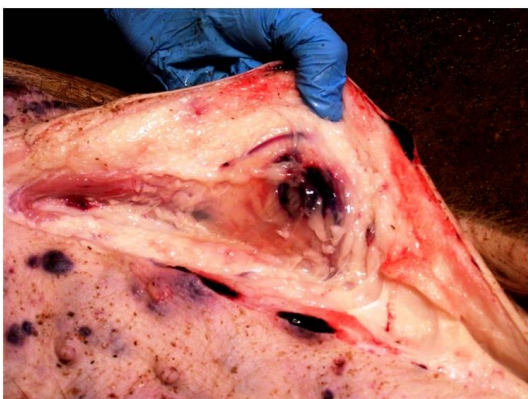
Hematoma y necrosis de tejidos subcutáneos