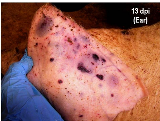
Hematomas y áreas de necrosis subcutánea en oreja