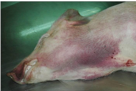
Enrojecimiento de la piel