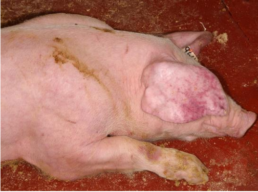
Eritema o enrojecimiento de la piel