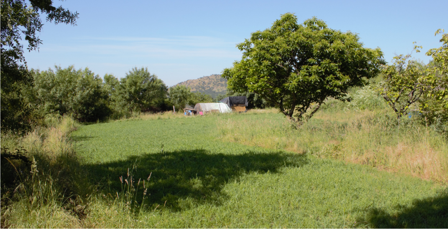
Reserva genética de PSC en finca privada dedicada al cultivo en agricultura ecológica.