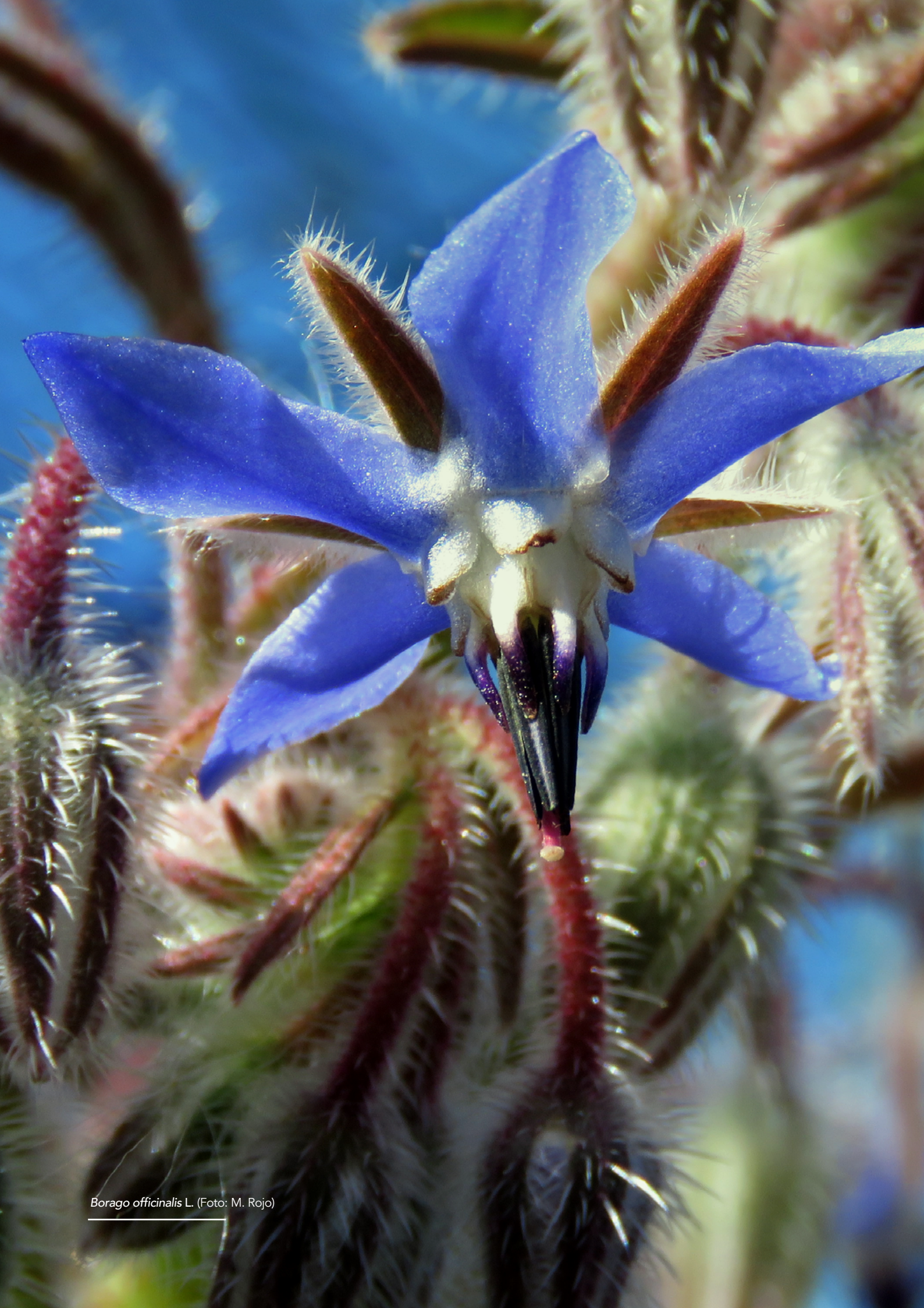
Borago officinalis L.