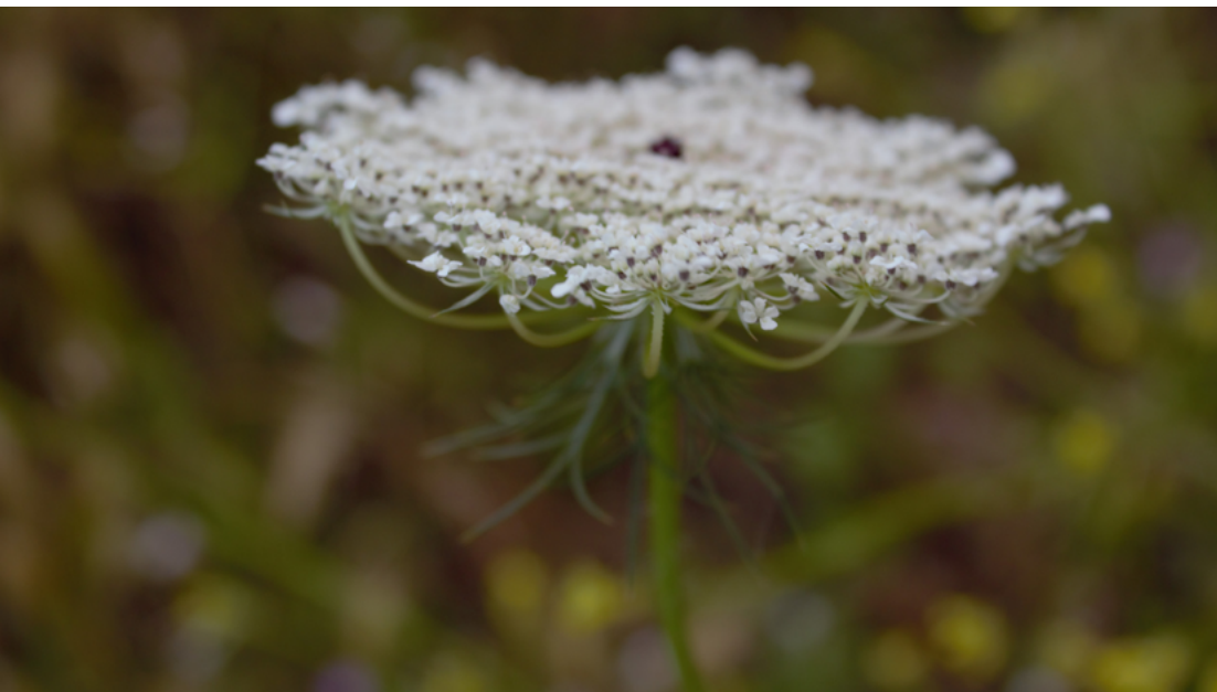
Daucus carota L., pariente silvestre del cultivo de la zanahoria, incluido en el Anexo I del Tratado Internacional sobre los RFAA.

El Tratado Internacional promueve un enfoque integrado de la prospección, conservación y utilización sostenible de los RFAA, haciendo mención particular a la conservación in situ de PSC y PSUA