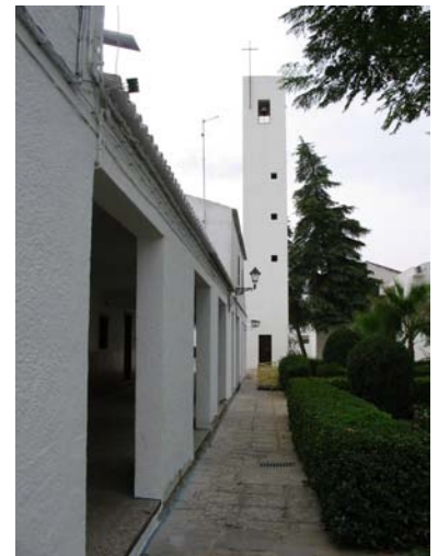
Imagen 5. Iglesia del poblado Maruanas (Córdoba).

En muchas ocasiones, el arquitecto va a seguir un esquema muy tradicional, a través de una conformación ligada al urbanismo de los pueblos castellanos, donde el templo religioso se convierte en un hito, en un símbolo necesario para un espacio creado en un tiempo no asumible. En otras