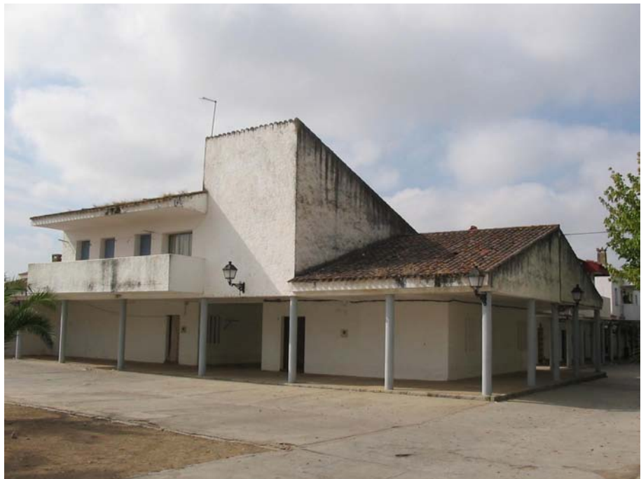
Imagen 6. Edificio de usos administrativos en Puebla de la Parrilla (Córdoba).

ocasiones, la iglesia será el lugar donde ensayar esquemas que se posicionan en la modernidad, en ejemplos donde se apuesta por la fusión y la sinergia entre propuestas arquitectónicas, pictóricas y escultóricas (imag. 5). Ejemplos como Algallarín (Córdoba, 1953), obra de Carlos Arniches, 25 o el conjunto de poblados realizados por Fernández del Amo, son sin duda algunos de los ejemplos más brillantes de la arquitectura de la década de los 50. 26 De todas formas, este hecho no deja de pasar desapercibido en el contexto habitacional, y no es sino una situación que puede en determinadas ocasiones forzar el sentimiento de extrañamiento, de alejamiento de lo vernáculo (imag. 6).