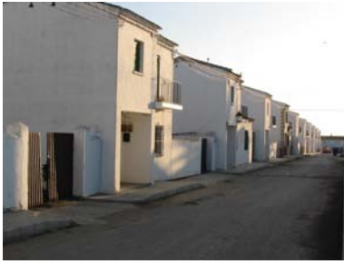
Imagen 3. Perspectiva visual de viviendas en el poblado del I.N.C. La Montiel, Córdoba.

“El plano de los poblados no tiene forma fija ni tampoco está determinado por una teoría urbanística aunque se haga el seguimiento de alguna. Como norma general, tras el análisis de los planos podemos indicar que tienen un núcleo central donde se ubican el Ayuntamiento, Iglesia, Centro de Sanidad, etc.; la existencia de una calle principal que desde la carretera se une a ésta con el conjunto urbano y, a veces, dos calles principales que se cruzan en este lugar.” 13