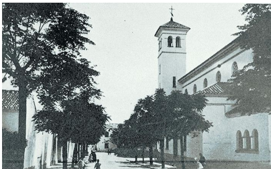
Imagen 2. Barriada Arrese. Málaga, década de los 40.

Esta era la situación creada a través de un conflicto mal entendido, donde se entremezclan cuestiones políticas que parecen querer solucionarse a través de la imagen, del profundo significado de la imagen arquitectónica.