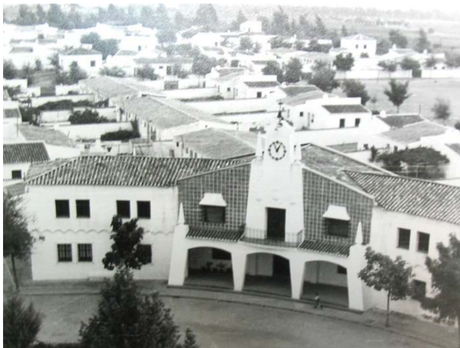
Imagen 4. Plaza principal de Algallarín (Córdoba), Carlos Arniches, 1953.

inevitables que no admiten remedios parciales. Haríamos una casa modelo para nuestros poblados rurales, hasta lujosas llegando el caso, y se derrumbarían nuevamente por falta de fundamento económico, con tanto más estrépito cuanto mayor fuera el contraste entre lo que la tierra puede dar y lo que debiera producir para sostener tales obras llenas de idealismo, pero faltas de realidad.” 15