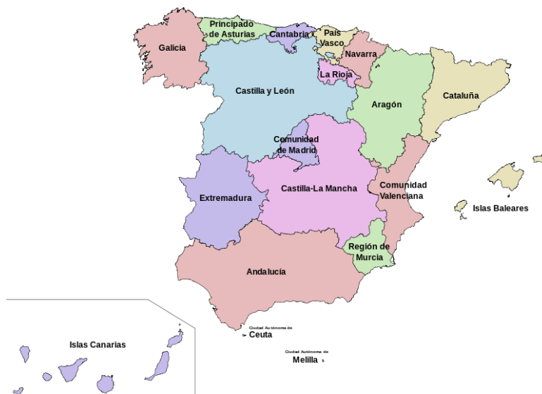
Mapa político de España con las CCAA y Ciudades autónomas

A su vez, en cada provincia existe una Jefatura o Delegación Provincial de Agricultura y Ganadería, dependiente del Servicio de Sanidad Animal de cada Comunidad Autónoma, de la que dependen las Unidades Veterinarias Locales (UVL) en el ámbito comarcal.